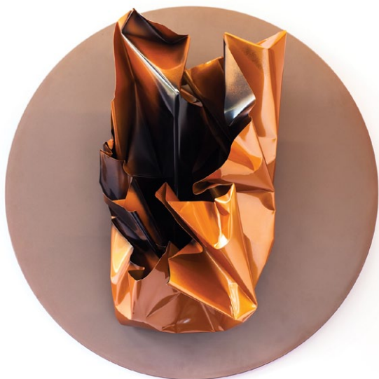
Mikhailo Deyak "Flower" from the series Genesis, diametr 80 cm, colored metal on chipboard, 2016

самобутністю і величезною кількістю рідкісних художніх технік, таких як іконографія на склі, мабуть все це відбилосся у підсвідомості автора, звідси тяга до подібних експериментів. Також на Scope Miami Beach 2016 представлена скульптура "Flower", створена у рамках циклу арт-об'єктів Genesis, який виник коли сенситивність художника почала шукати нові форми вираження. Таким чином широка, динамічна і відкрита живописна техніка Михайла Деяка трансформувалась у новий пластичний стиль: з'явилася серія експресивних, абстрактних скульптур. Отже, це композиції з металу, що виражають собою асоціації з певними предметами чи явищами, але роботи не алегоричні, глядач може пов'язувати їх зі своїми власними враженнями. Як зазначає художник: "У цих об'єктах втілені асоціативні речі які так чи інакше впливали та надихали мене в різних ситуаціях. Думка скоріше не закінчена тому глядач зможе її закінчити завдяки своїй власній уяві".