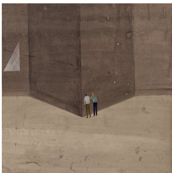
Maria Sulymenko "Untitled I", 68x66 cm, paper/watercolors/guasch, 2013

29 ноября - 4 декабря 2016 года, Майами, США (USA 801 Ocean Drive Miami Beach, Florida)